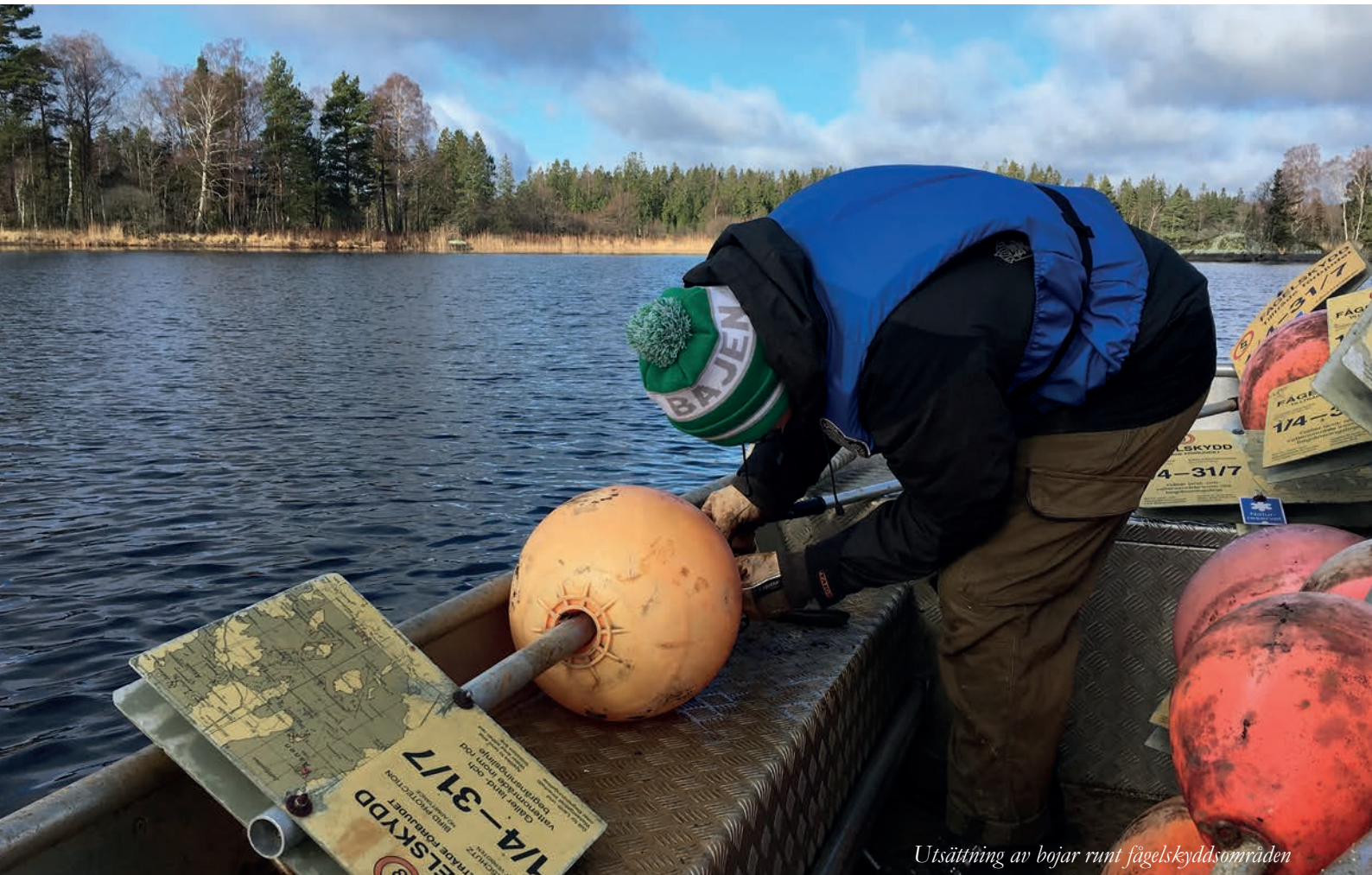
Utsättning av bojar runt fågelskyddsområden

Vill du kontakta Åsnentillsynen ring 070-202 22 51.