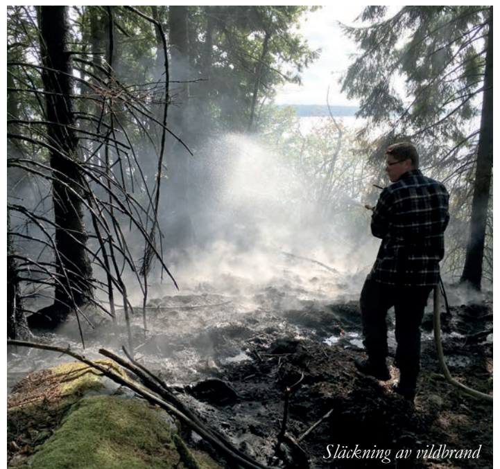
Släckning av vildbrand

Vill du kontakta Åsnentillsynen ring 070-202 22 51.