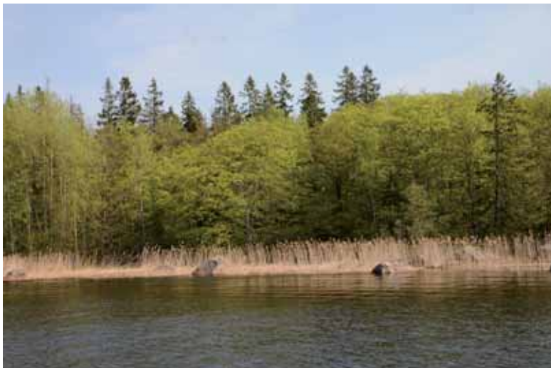
Ädellövskog vid Agnäs